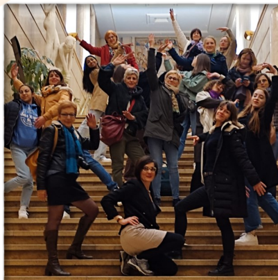
ID Habitants Un grand moment intergénérationnel pour l'atelier danse du jeudi. Participation aux Rencontres chorégraphiques Irène Popard à Paris