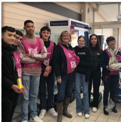
Mobilisation des bénévoles à la collecte des Restos du Cœur. Participation des jeunes « Projet Barcelone »