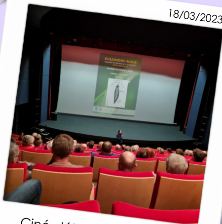
Ciné-débat à L'Atalante « Essaimons-nous » en présence de la réalisatrice