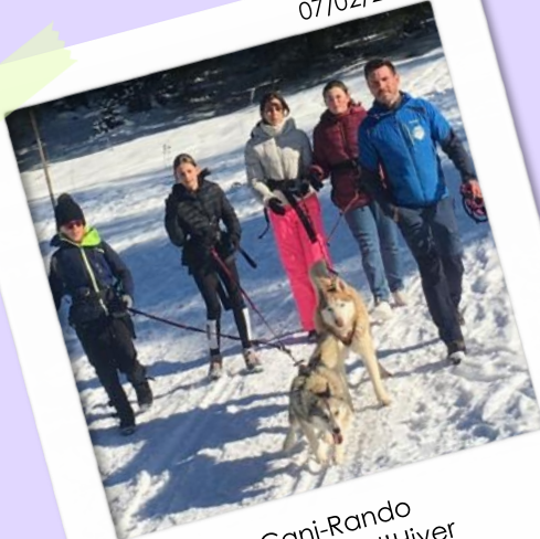
Cani-Rando Vacances d'Hiver Service Jeunesse